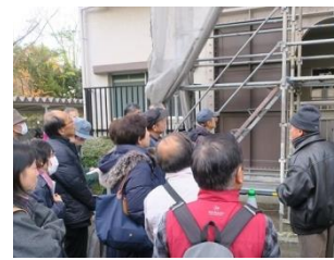
2019年・大規模修繕工事見学会 於・エメラルドマンション膳所