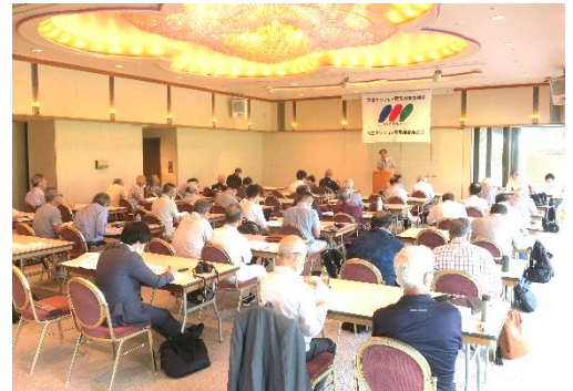
6月18日に開催された 管対協第44回定期総会

多くの会員の皆さまの御来場をお待ちしておりますので、多数の会員の皆さまにご参加いただきますようご案内申し上げます。