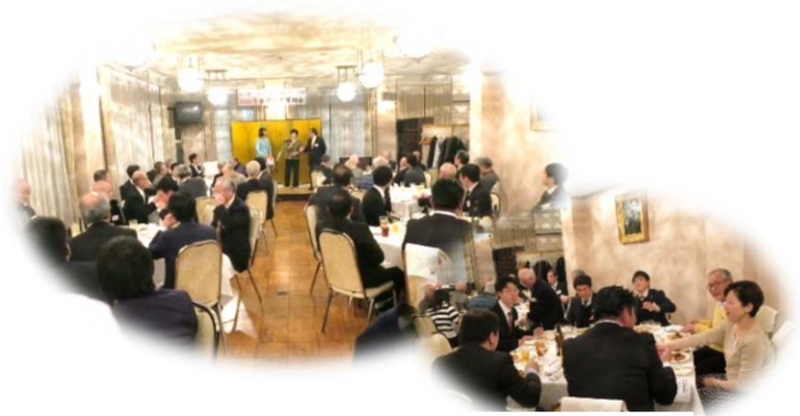
前回の2020年1月 新年賀詞会