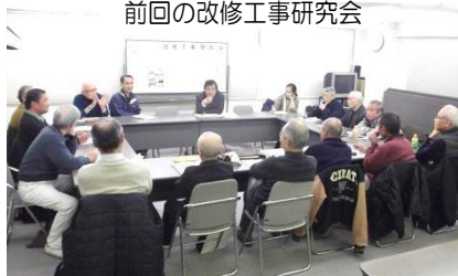
前回の改修工事研究会