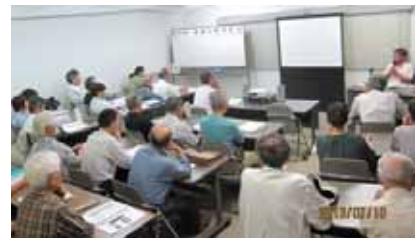
前回の改修工事研究会(7月10日)