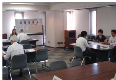
前回八月の合同面接会