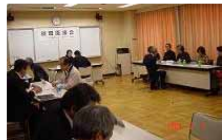
前回の合同面接会では5名の受講生が採用されました。